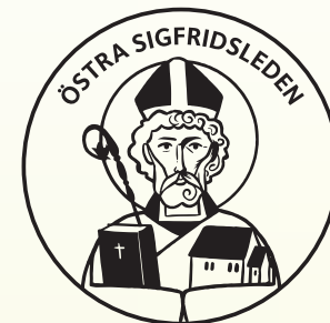
Illustration: Ellen Ingvarsson